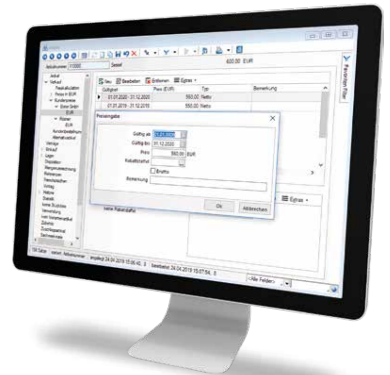
Legen Sie für einzelne Artikel kundenindividuelle Preise fest.

Erleichtern Sie Ihren Kunden das Suchen und bieten Sie ihnen einfache Filterfunktionen nach Produktfamilien oder Produktgruppen sowie Produkteigenschaften an. Mit dem Zusatzmodul „Sachmerkmale“ können Sie Ihren Produkten einfach bestimmte Eigenschaften zuordnen.